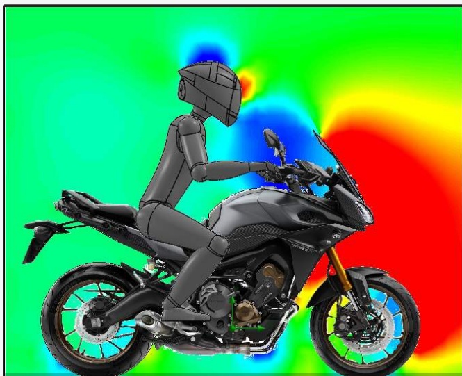
ORIGINAL SCREEN RESULTS