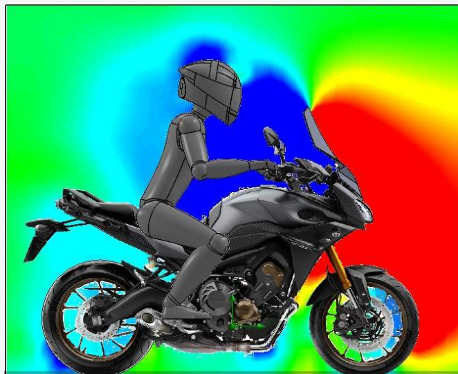
PUIG SCREEN RESULTS